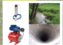
Pompe immergée ou groupe hydrophore