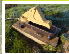
Pompe à museau