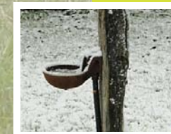
Eau de conduite