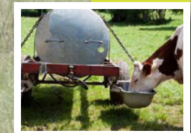
Tonne à eau